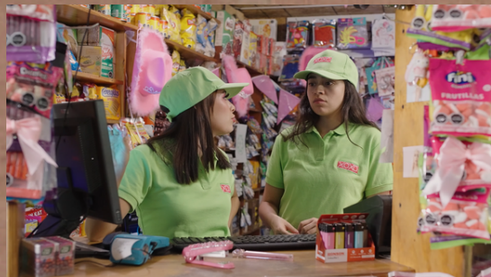
Sin Querer Queriendo - Piloto de Serie Ficción Dirección y Guion