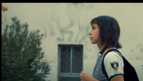
"Piola" (2020) Luis Alejandro Pérez