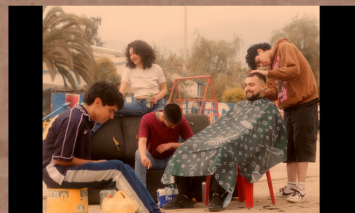
La Faena - Cortometraje Ficción 2do Asistente de Dirección