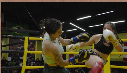
Lobita - Cortometraje Documental Director y Dirección de Fotografía