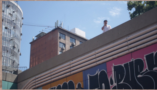
5 P.M. - Cortometraje Ficción Dirección y Guion