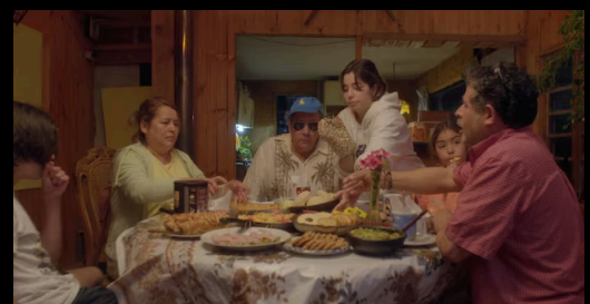
"Gracias por venir" (2023) Taiyo Yamazaki