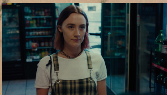
"Lady Bird" (2017) Greta Gerwig