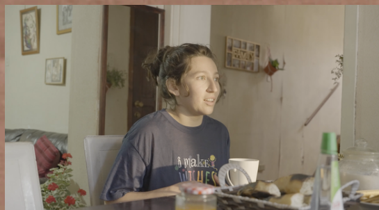
Setenta y Veinte - Piloto de Serie Ficción Dirección de Fotografía