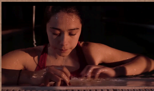
Piel de Nácar - Cortometraje Ficción Dirección de Arte