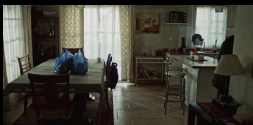
"Gran Avenida" (2020) Moisés Sepúlveda