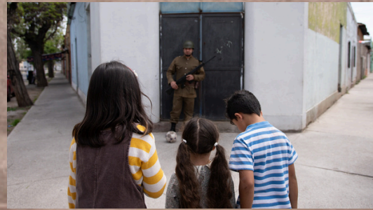
Qué Feliz Navidad - Cortometraje Ficción Continuidad