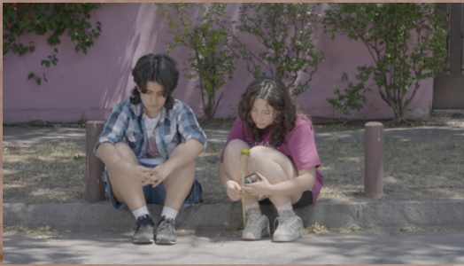
Setenta y Veinte - Piloto de Serie Ficción Dirección y Guion