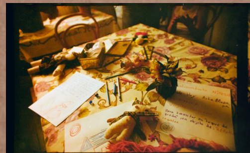
Qué Feliz Navidad - Cortometraje Ficción Ambientación