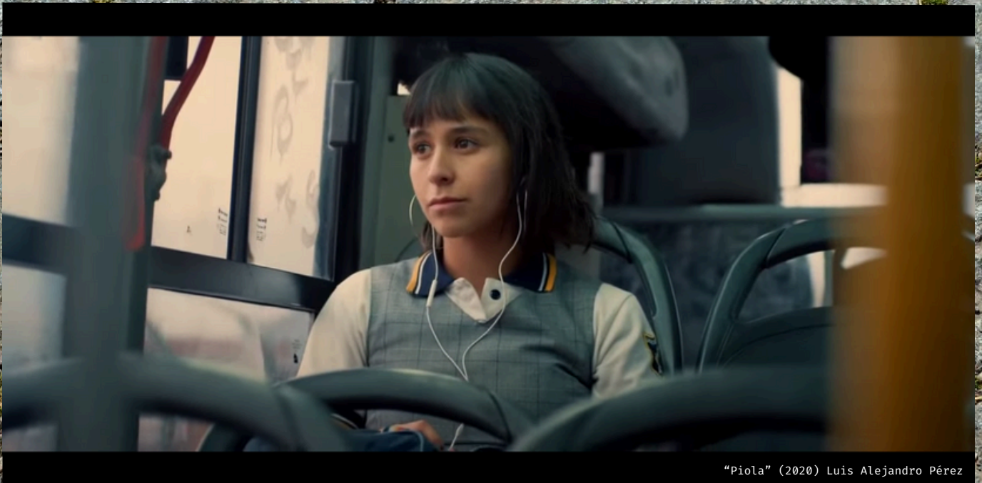
"Piola" (2020) Luis Alejandro Pérez

31 de diciembre de 2024. Cuando la familia de Jajo (17), impulsiva adolescente, comienza a deshacerse de las pertenencias de su recientemente fallecida abuela, la joven se roba el ánfora que guarda sus cenizas por miedo a que también se las lleven. Paseando por las calurosas calles de Santiago, Jajo se da cuenta de que su abuela sigue estando presente en ese objeto. Sus intentos por disfrutar este día en compañía de su abuela serán interrumpidos por la incomprensión de sus amigos y desconocidos con los que cruzará caminos en distintas situaciones aparentemente absurdas, pero que le permitirán entender, en medio de una fiesta de año nuevo en una junta de vecinos, que la presencia de su abuela va más allá de lo tangible.